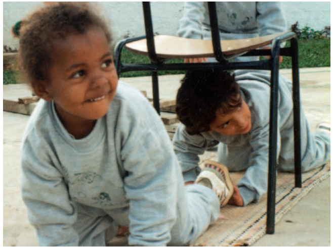
Leuchtende Kinderaugen sagen mehr als Worte

Eine neue Schule, eine Sporthalle, eine Küche und ein Brunnen wurden für Bairro do Carmo gebaut. Dies schenkte 800 Schülern und 12 Lehrkräften neuen Lebenssinn und -aufgabe.