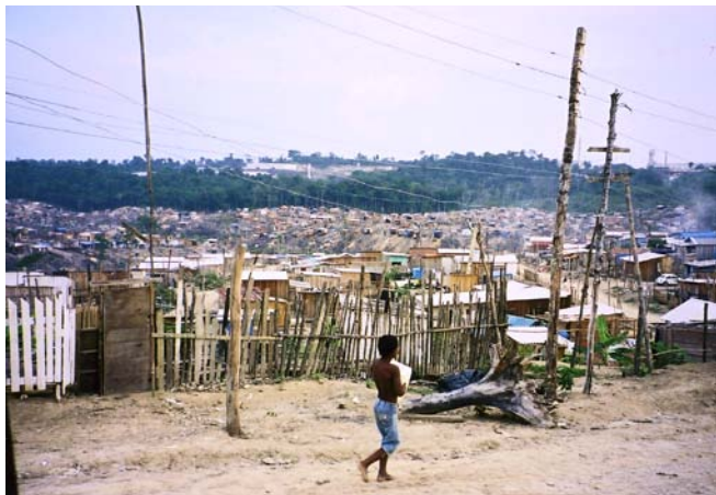
Hütten der riesigen Invasion «Nuova Esperanza» auf Urwaldboden gebaut

den Urwaldregionen haben die Urwälder abgeholzt, das Land in Anspruch genommen und unter schwierigsten Bedingungen urbar gemacht. Unterstützungen vom Staat wurden nicht erteilt. Es entstanden Siedlungen ohne Wasser, Strom und Kanalisation – schlimmste Herde für Krankheiten