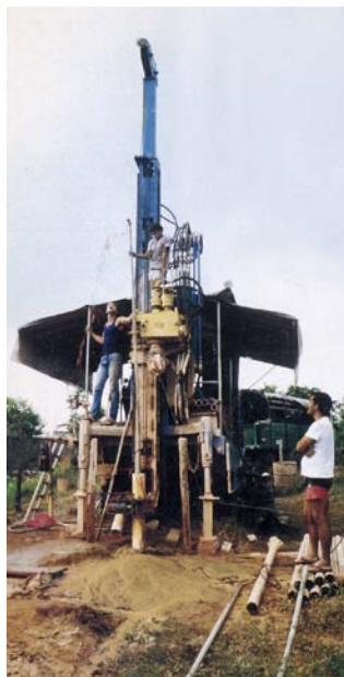
Die neue Brunnen-Bohrmaschine, bis 150 m tief kann gebort werden. Ein Geschenk aus der Schweiz und Italien von Saverio Mondini und seinen Freunden.